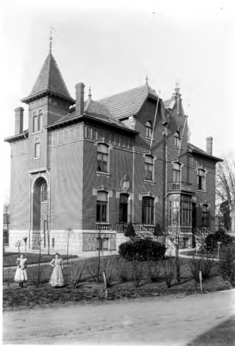
De door de Duitsers gevorderde villa Kreykamp in Steyl.

september. Over deze periode wordt de fictieve huurwaarde gedeclareerd, die deels wordt vergoed. Of er iets beschadigd, vernield of vermist is blijkt niet uit de stukken.