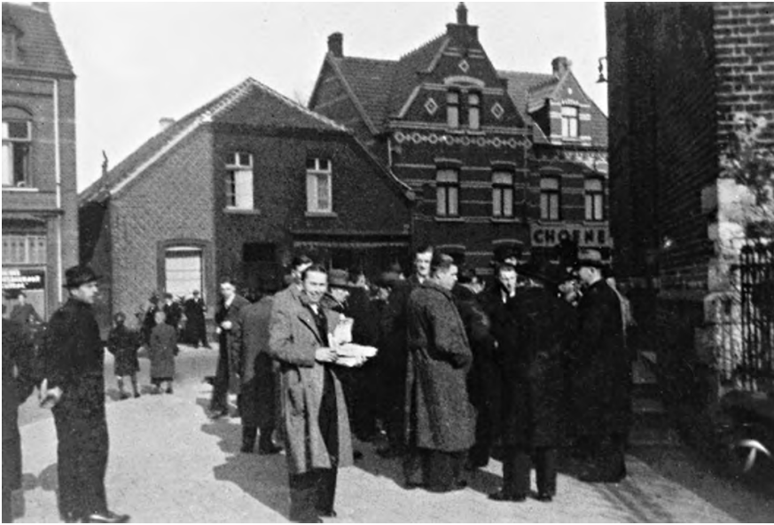
Colporteurs van de Nederlandsche Unie voor de ingang van de Sint-Martinuskerk.