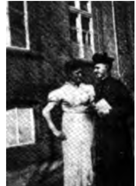
In Steyl gelegerde SS'ers die zich verkleedden in een priestertoog of jurk.

gebouwen van het Generalaat en Noviciaat worden gevorderd. Er zit voor de paters, broeders en novicen niets anders op dan te verhuizen naar het St. Gregoriushuis aan de overzijde van de straat. Daar is echter hoogstens voor 200 en geen 350 personen plaats. Als rector Miss dit tegen de bevelvoerende officier zegt, antwoordt deze: 'Es geht. Es muss gehen! Anderswo ist er auch gegangen und wenn der Platz nicht reicht, nehmen die Nachbarn die übrigen auf!'