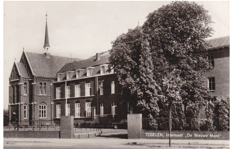
Internaat van De Nieuwe Munt op een ansichtkaart van latere datum.

De actie van de bisschoppen is tegen het zere been van de Duitsers. Vijf katholieke dagbladen die de herderlijke brief publiceren, krijgen een fikse geldboete, terwijl er twee worden verboden. Hetzelfde