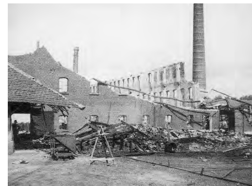
Ravage bij fabriek Teeuwen.

met ongekeende hevigheid en vond, zoals mij later bleek, voornamelijk voedsel in het vele houtwerk, voornamelijk droogrekken., welke in de fabriek aanwezig waren. Bij het fabrieksterrein zag ik in de grond een tweetal, gedeeltelijk in de grond gedrongen Engelse brandbommen, van het bekende zeshoekige model. De blikken bovineinden staken uit de grond. De brand had onmiddellijk een reusachtige omvang aangenomen en ondanks ingespannen blusarbeid kon de fabriek niet behouden blijven, zodat deze - hoewel ook de Venlose brandweer aan de blussing deelnam - geheel uitbrandde. Blijkens een nadien door de werkbaas der N.V Paul Teeuwen, genaamd J.H. Peeters, die een woning op het fabrieksterrein naast het kantoor heeft, aan mij afgelegde verklaring, waren te ongeveer 2 uur dien nacht over de gehele fabriek een groot aantal, naar zijn schatting circa 100 brandbommen afgeworpen, waardoor onmiddellijk