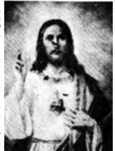
H.Hartplaat waarop door SS'ers met de bajonet is geoeffend.