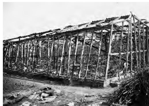
Verwoeste kassen aan de Broeklaan.