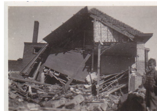
Bij Scholten in de Hoogstraat.