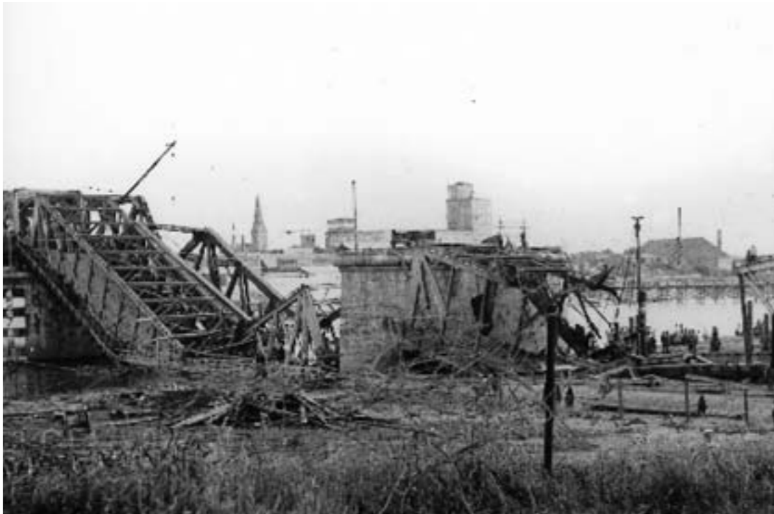
Door de Duitsers vernietigde Maasbrug.

voor de Maasbrug bij Venlo. Ze zijn dus in de nabijheid!