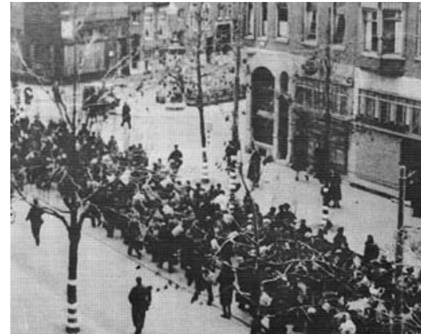
Razzia in Rotterdam.

Ik dacht toen: nu ben je er geweest, maar wij moesten doorlopen. Midden op het plein stond een stellage. Daar was een NSB'er aan het spreken. Wij moesten allemaal mee bouwen aan een nieuw Europa en al die flauwekul meer. Hij zei ook dat wij een kleine mars zouden maken en, als wij probeerden te vluchten, er direct geschoten werd. Dat wisten wij dan en werden toen afgevoerd. Wij moesten met vier man naast elkaar lopen midden over de weg. Om de 10 tot 15 meter liep een soldaat met een geweer in de aanslag. Er werd verteld dat we naar Amersfoort zouden gaan. Anderen zeiden naar Duitsland, naar niemand wist het zeker. Toen ik aan mijn tweede trip begon was ik nog tamelijk fris, maar dat duurde niet lang. Dat onzekere maakte je erg moe. Twee keer werd er een sanitaire stop gemaakt van tien minuten,