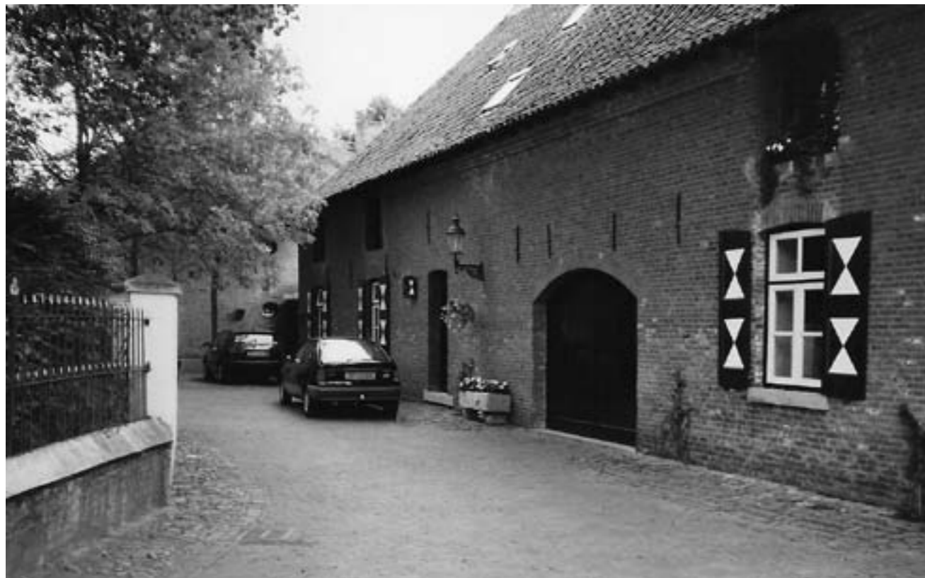
Boerderij bij kasteel Kessenich.