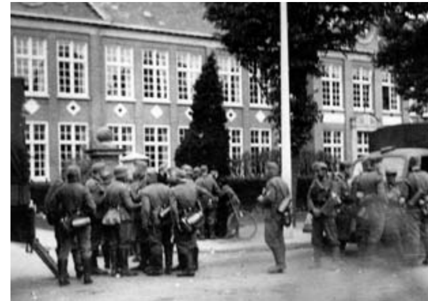
Duitsers voor de St. Jozefschool.

de lucht was, wel goed om zich heen kijkend en het geweer in de aanslag, maar ze werden door niemand of niets tegengehouden, en er viel geen schot! Was dat nu oorlog? Er volgde er nog een. Eerst toen een derde zijspan op enige afstand naderde, ontstond er enige commotie. Zij stopten voor onze neus en vroegen de weg naar Steyl. Slager Wiel Dings, die er in een lange bebloede witte jas bij stond,