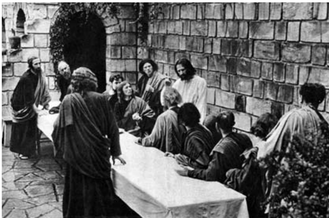
Het Laatste Avondmaal (coll. mevrouw Leenders-Dondit).

eerst overleg moeten plegen met het bestuur. Gelukkig is er nog tijd om opnieuw een baard te laten groeien, hetgeen door deze spelers werd toegezegd.' De laatste oproep wordt nog eens herhaald op de sinterklaasavond van zondag 3 december, als de voorzitter de mannelijke spelers die hun baard laten staan ras-passiespelers noemt en ook dames en jongens aanspoort hun haren te laten groeien.