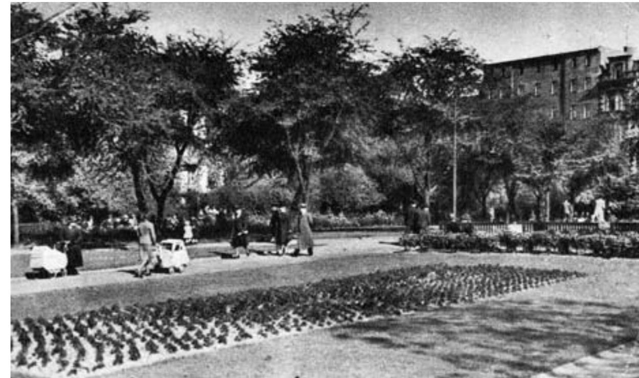
Blik op Katowice rond 1940.