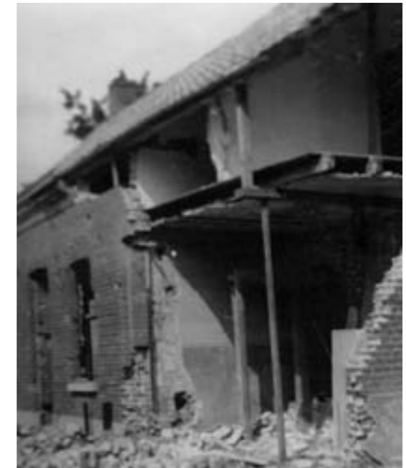
Huis op de Venloseweg, door bommen getroffen