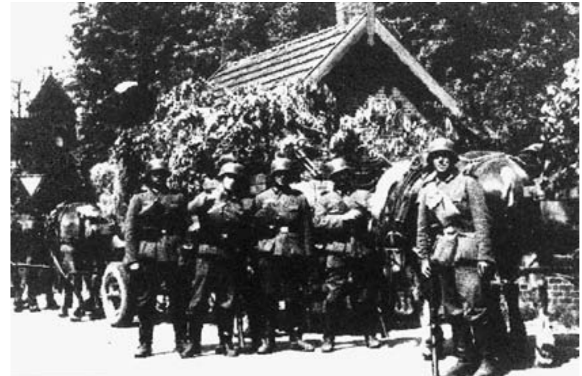
Duitse militairen op 10 mei 1940 in de Muntstraat bij hoek Muntstraat/Venloseweg.

naar het lachen verderop in de straat en in de verte kon men Denessen, die bij het symfonie-orkest was, op zijn trompet horen repeteren. Toen het helemaal duister was, riepen de mensen elkaar 'Welterusten' toe. Men kon elkaar niet meer zien, maar men wist wie er nog meer buiten zat. Dan klonk het vanaf de overzijde van de straat: 'Hetzelfde!' en 'Slaap lekker!' Was het maar altijd donderdag gebleven! Was die vrijdag maar nooit gekomen! Die vrijdagmorgen werden we wakker van allerlei vreemde geluiden. Geluiden die we van tevoren nooit hadden gehoord. De hardste knallen waarmee wij vertrouwd waren, hoorden we bij het vogelschieten of als kwajongens met