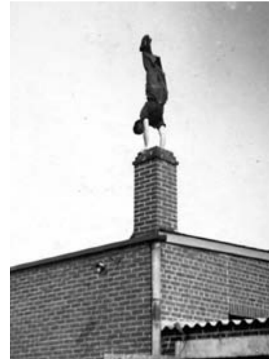
Hoogstandje tijdens middagpauze op het werk.