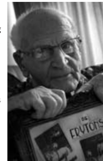
Fried Didden nu.

al naar huis. Mijn collega moest nog een dag wachten en zou dan naar huis komen.