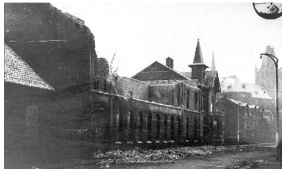
Fabriek van O. Assmann op de Venloseweg, door granaten getroffen en vervolgens uitgebrand.

Tegen vier uur 's middags hield het vuren op en we gingen eens een kijkje nemen in het huis. 't Zag er verschrikkelijk uit en 't was er niet om uit te houden van de tocht. In de tuin ook alles in desorde. Takken van de bomen geschoten, hele bomen kapot geschoten en dan de rommel