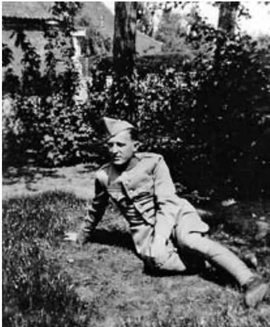
Bèr achter in de tuin.

stuurde om de Boeren te helpen. Maar dat waren allemaal vage begrippen. Dat was allemaal lang geleden, toen wij nog niet eens waren geboren.