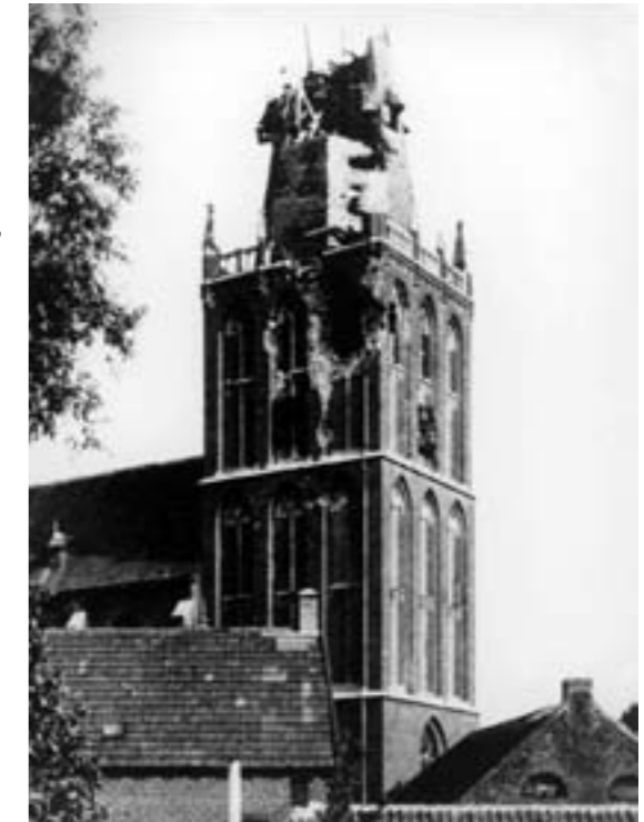
De kerktoren, geraakt en ingestort.