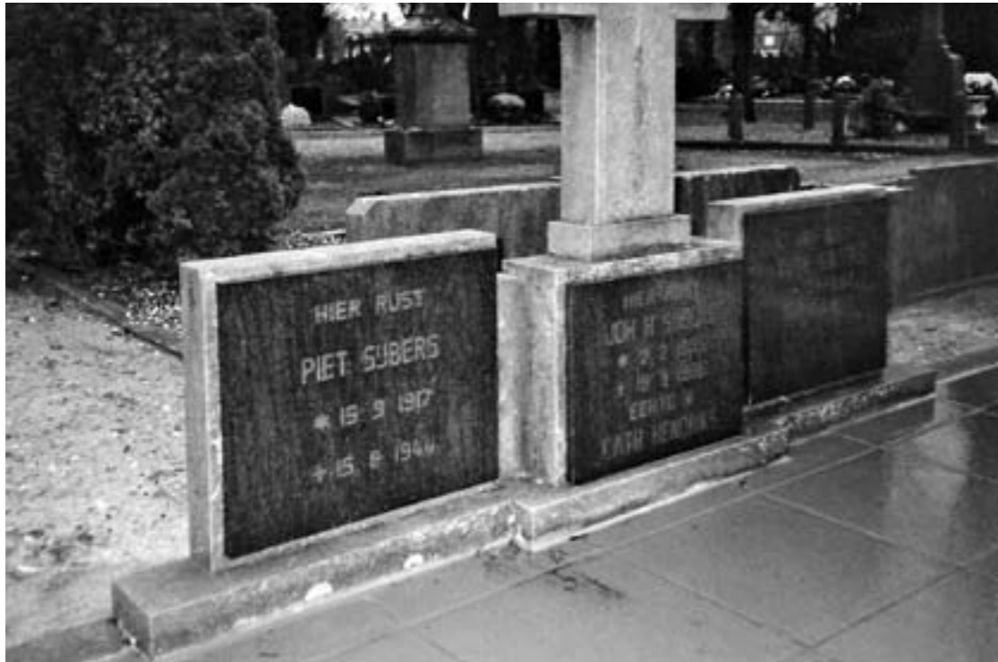
Graf Piet Sijbers en zijn ouders.

ouders rusten. Het graf is tot op de dag van vandaag nog steeds aanwezig.